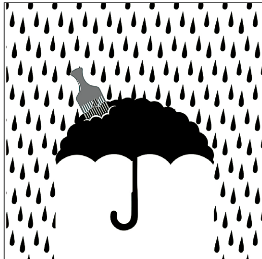
Figura 4. Pelo impermeable (Quiñónez, 2025). Fuente: elaboración propia.

No es una novedad, ni un rap, ni un concurso; pero si, cuando a un todo se le sacan las características fundamentales y sigue siendo ese todo, seguramente hay un algo que es una novedad.