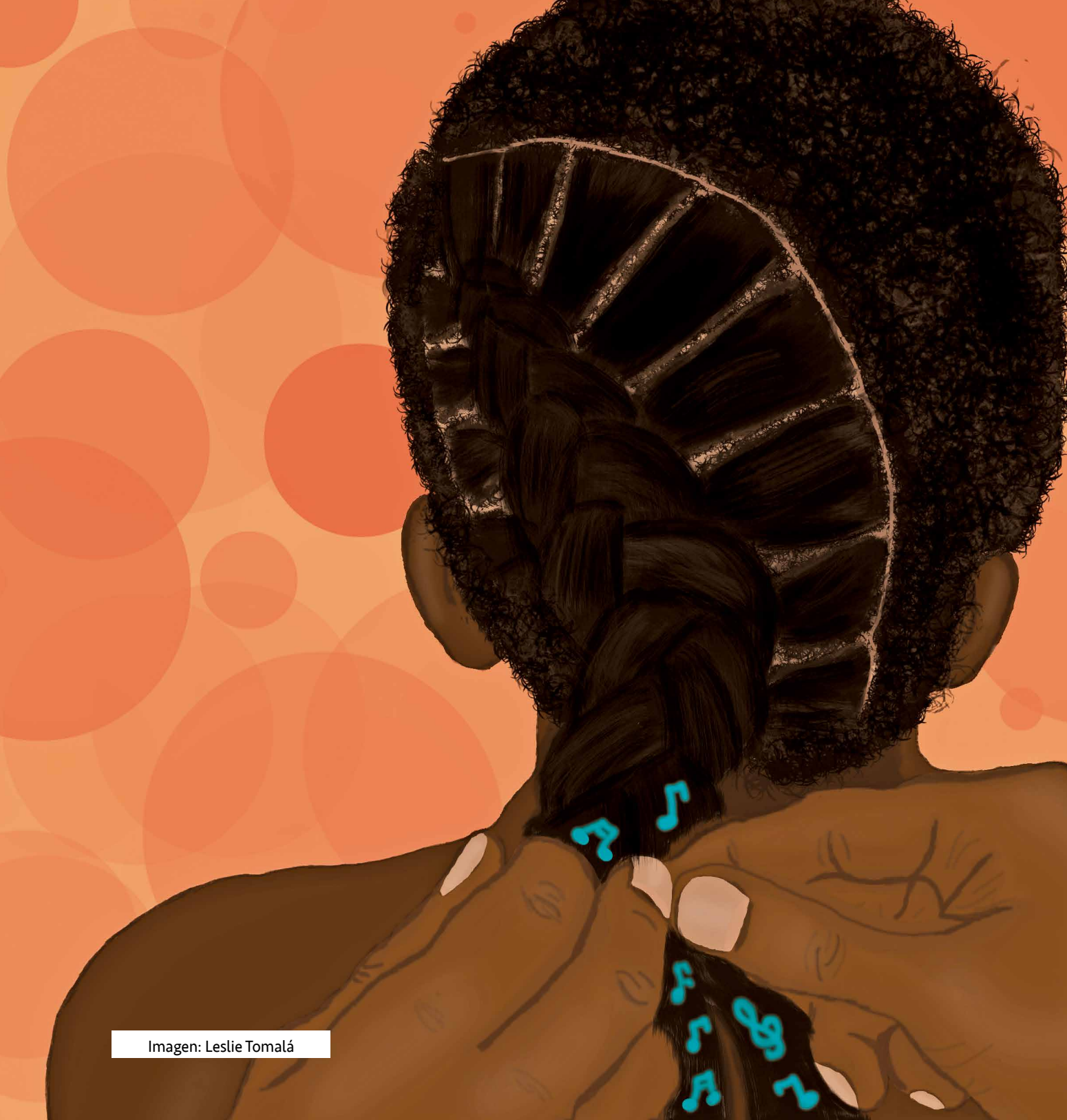
Imagen: Leslie Tomalá