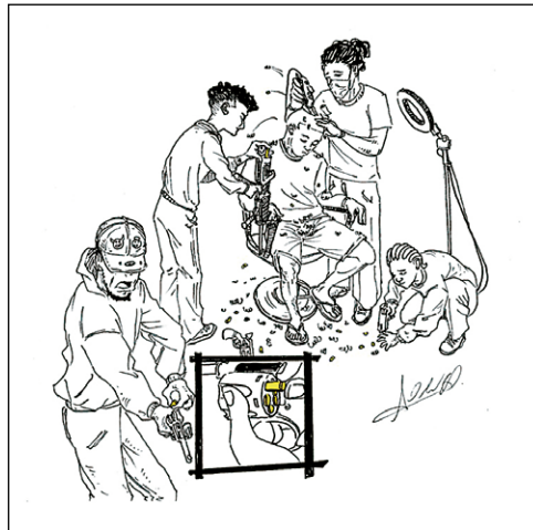
Figura 3. Pelo como munición (Quiñónez, 2025).

Esta ilustración traduce visualmente la línea: “si me corto el pelo ya tendría munición para mi escopeta”. Formalmente, la escena agrupa a varios personajes alrededor de un joven al cual le están cortando el pelo, este pelo que posteriormente se convierte en balas, con una composición circular que no sólo representa visualmente este verso, también la violencia estructural a la que estamos sometidos. Conceptualmente, la pieza denuncia cómo la violencia se naturaliza y se convierte en recurso: el propio cuerpo es material y moneda de cambio (Figura 3).