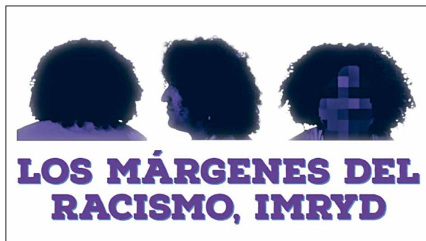
Figura 2. Los márgenes del racismo (ALMARGEN, 2022).

Este evento casa adentro coloca en el centro la idea de que el pelo/cabello “es un importante elemento para comprender la interseccionalidad que se da entre el proceso de construcción de una identidad y, a su vez, los múltiples elementos que sirven para generar estereotipos, formas de discriminación y sistemas de clasificación y adscripción” (Félez, Cueto & Jiménez, 2024, 3).