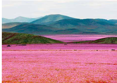
Figura 1. Desierto florido, desierto de Atacama (Chile).