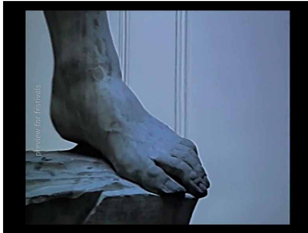
Figura 4. Fotograma de El silencio es un cuerpo que cae (Agustina Comedi, 2018).

recorre el cuerpo, lo segmenta y lo disecciona. Magalí Haber (2024) piensa el modo en el que en estas imágenes hápticas se inscribe una forma contundente del deseo. Comedi no recupera así las imágenes de su padre, sino su mirada. ¿Es posible organizar un retrato no a través del rostro sino de la mirada del sujeto retratado? (Figura 4).