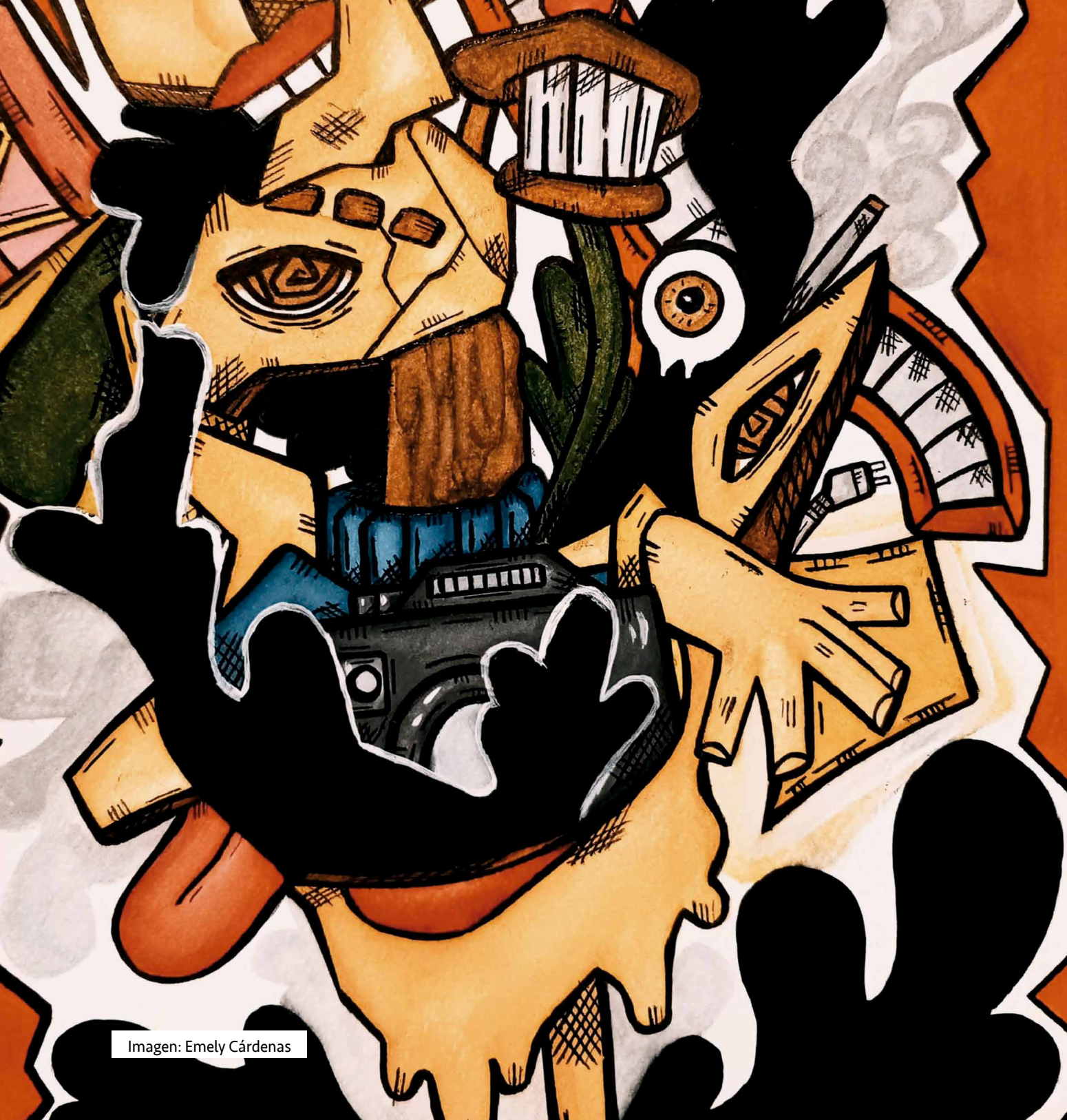
Imagen: Emely Cárdenas