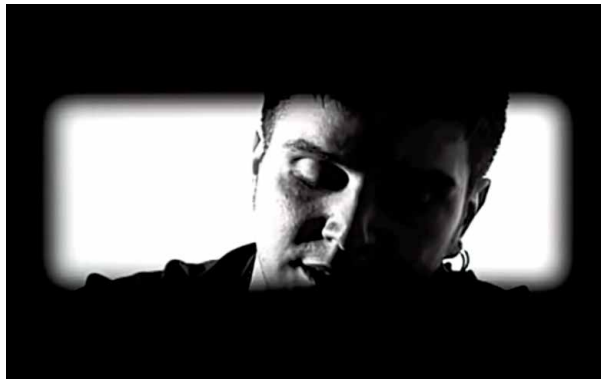
Figura 3. Fotograma de 33 (Kiko Goifman, 2002).

El retrato fallido se hibrida así, como en Diário de uma busca , con un autoretrato. No se trata, sin embargo, de un autoretrato que recomponga una identidad plena, sino que funciona como un retrato desplazado de la madre buscada. ¿Podría ser que el rostro del hijo evidenciara el rostro ausente? ¿Se podría recomponer, a través del rostro filial, el semblante materno? Se trata, en este sentido, de interrogar si el autoretrato del hijo puede ser un acercamiento indirecto, indicial, tentativo e inexacto del rostro materno. De esta manera el retrato opera una