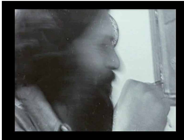
Figura 2. Otro fotograma de Diário de uma busca (Flávia Castro, 2010).

más indeterminado e interrogativo. Es cada vez más improbable encontrar el rostro que se buscaba. Ese borramiento, sin embargo, habilita otro movimiento: proyectar sobre ese semblante una serie de imágenes, una proliferación de testimonios, una identidad imaginada. Si David Le Breton señala que “Los signos del cuerpo, y especialmente del rostro, son huidizos, contingentes, propicios a la proyección imaginaria, ambiguos en su manifestación” (2010, 123), esto se radicaliza en un retrato que no monumentaliza al padre; sino que rastrea algunos segmentos de su rostro, algunas esquirlas de esa identidad afectada por la historia, algunas huellas de la identidad de ese padre muerto.