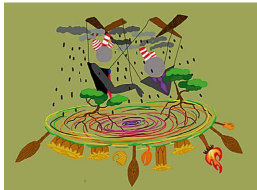
Figura 4. Inspirado en el poema “Arquitectura del Estado (Parte 2)”, Andrés Caicedo.

Petróleo para otros, miseria para el pueblo, contaminación gratis como pan nuestro diario.