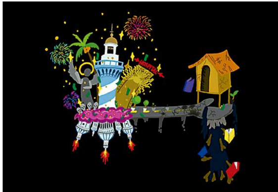
Figura 3. Inspirado en “Arquitectura del Estado (PT1)”, Andrés Caicedo.

La ilustración de la Figura 3 muestra, con luces estridentes, las mismas luces que Esmeraldas levanta frente a nuestra experiencia vital. Las casas de colores vivos, las licras en tonos flúor y la música de decibelios delincuenciales funcionan como una máscara, un artificio que disimula la pobreza y tiñe de exotismo la ausencia del Estado. Esmeraldas aparece desvencijada, envuelta en estallidos cromáticos, con edificios que no sólo enmarcan la violencia, sino que parecen dispararla.