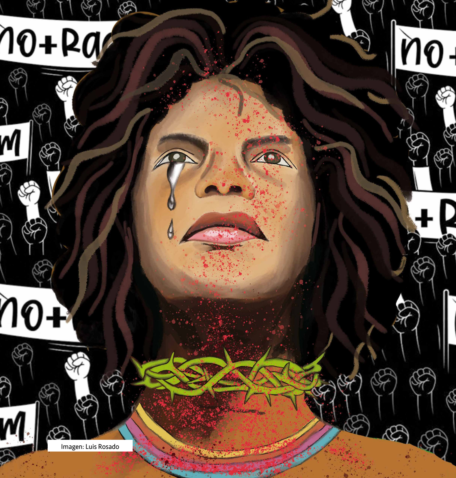
Imagen: Luis Rosado