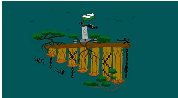
Figura 1. Inspirado en el Poema “Rebeldía perdida”, por Andrés Caicedo.

donde la libertad es cicatriz y no bandera prestada.