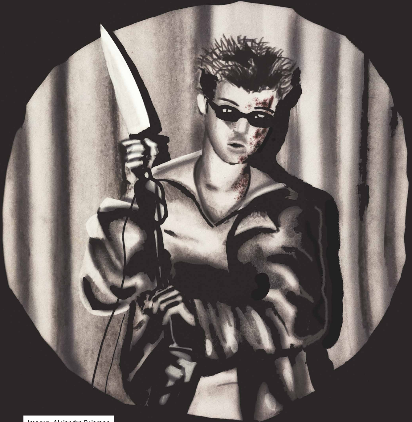
Imagen: Alejandro Bejarano