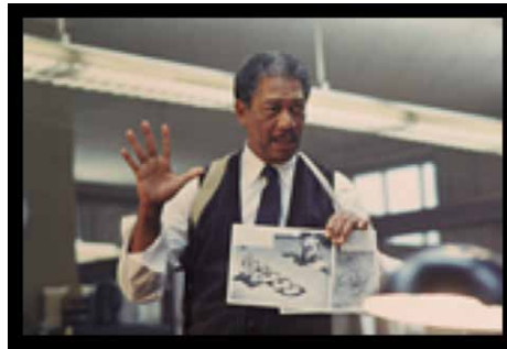
Figura 1. Uno de los protagonistas de Seven , Morgan Freeman.

Lo que me cautivó del guion es el aspecto de unir los puntos. Es una película de unir los puntos que habla de la inhumanidad. Es psicológicamente violenta. Implica mucho, no sobre por qué lo hace sino sobre cómo lo hace. Tiene este elemento de maldad que es realista, pero no quería que la gente dijera: ¿No es esto lo más espantoso que has visto en tu vida? Lo que me da asco es la violencia que se supone que debes aplaudir (Taubin, 2017).