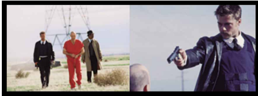
Figura 2. Los protagonistas de Seven : Morgan Freeman, Brad Pitt y Kevin Spacey.

de esta escalofriante revelación, su marido, el detective Mills, liquida a John Doe (el envidioso) en un arrebato de ira (el pecado capital que faltaba por aparecer en la trama) completando así el proyecto del asesino en serie. Este final no hace más que subrayar el maquiavelismo del asesino en serie, y supone un cierre pesimista y oscuro que no hace concesiones con el espectador. John Doe, a raíz de este film, se convirtió en uno de los asesinos en serie más célebres de la historia del séptimo arte.